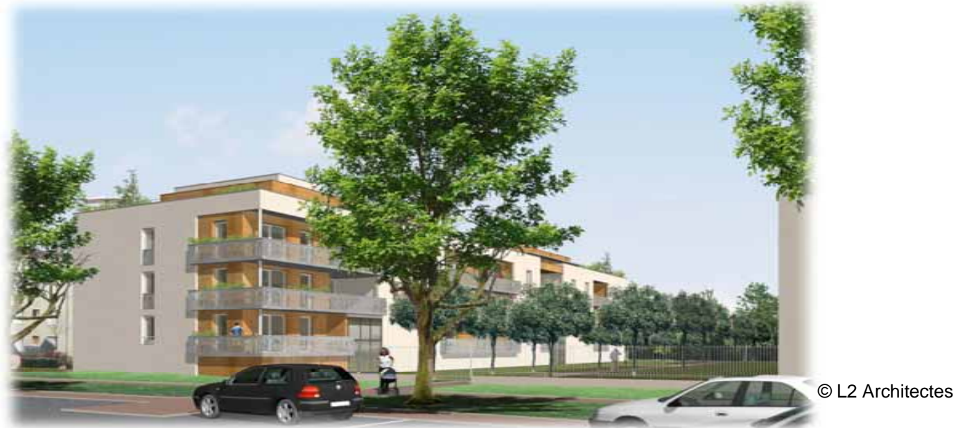
La 1 ère tranche de l'îlot 1 comprend 25 appartements : 1 T1, 6 T2, 16 T3 et 2 T5. La 2 ème tranche sera composée de 26 appartements : 8 T2, 16 T3 et 2 T5.

Une place de stationnement par logement est prévue, dont 4 adaptées aux personnes à mobilité réduite.